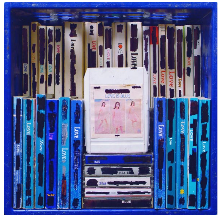
Cecilia Berkovic From Public Displays of Affection Lambda print, 33 x 33 cm, 2007

Un « regard lent », c'est aussi des collections de messages et de matériaux au fil du temps, cette stratégie humaine courante et futile de tempérer le passage du temps. Les images de Tek forment une élégante documentation de détritrus personnels conservés au fil des années. Il y a de fortes chances qu'un Avedon à qui l'on aurait commandé un reportage sur des bouts de papier pour Vogue