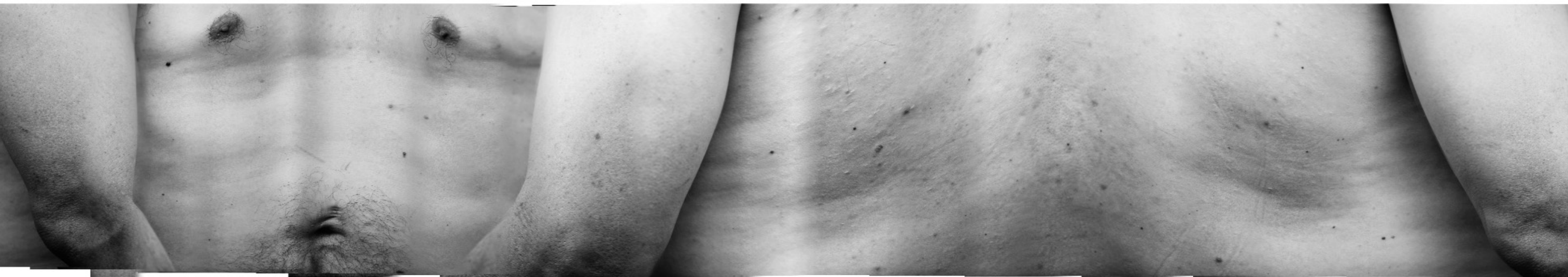
Tronc_15, impression au jet d'encre sur papier chiffon, 320 x 61 cm, 2007

Pascal DUFAUX 15/06/07 _Translated by Timothy Barnard