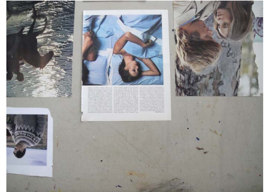
Les amants magazine , impression jet d'encre, 2010